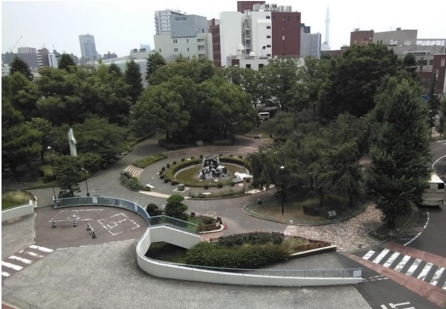
荒川公園は14,708㎡ 昭和43(1968)年7月に開園